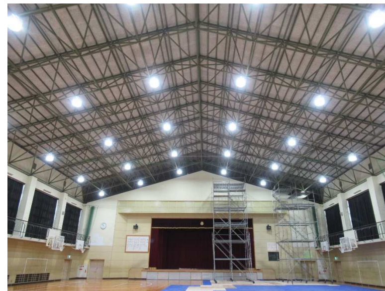
中学校体育館へのLED照明導入